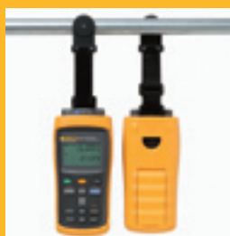
TPAK Magnet- halter