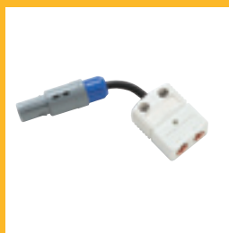
Universal- Thermoelement- adapter