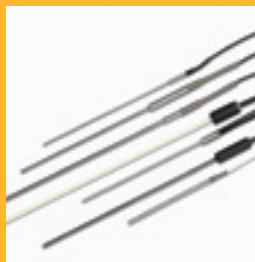
Kalibrierte Temperatur- sensoren

Eine breite Vielzahl an Zubehör hilft Ihnen dabei, Ihre Produktivität zu optimieren. Das folgende Zubehör ist für die meisten Benutzer von größter Wichtigkeit.