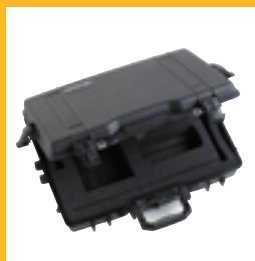
Hartschalen- koffer für Messfühler und Messgerät