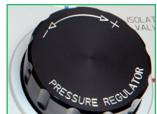
El regulador de presión Minerva MNR 180 está diseñado específicamente para su uso en aplicaciones de calibración y de prueba.