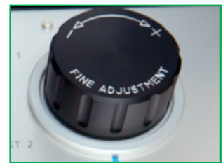
El regulador de volumen de precisión MNR 90 permite un control de presión muy ajustado de hasta 100 Pa