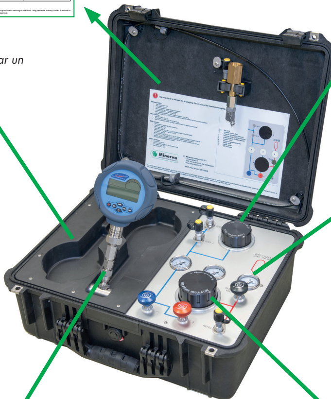
Espacio para almacenar un manómetro adicional