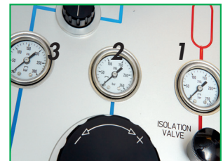
Los tres manómetros indican: 1. presión de la bombana 2. presión ajustada por el regulador de presión 3. presión en el puerto de prueba