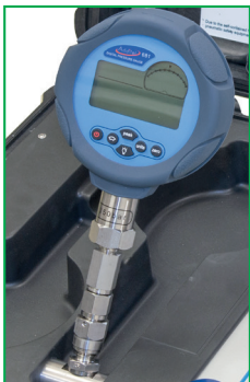
Una conexión giratoria de alta presión con conector rápido permite conectar y posicionar el manómetro Additel en el ángulo más conveniente para el operador.