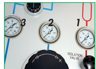
Los tres manómetros indican: 1. presión en el depósito de almacenamiento 2. presión ajustada por el regulador de presión 3. presión en la conexión de prueba