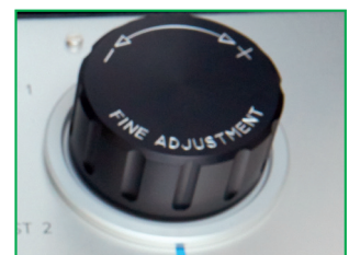
El ajuste de volumen variable de precisión Minerva mod. MNR 90 permite controlar la presión con una sensibilidad de 100 Pa