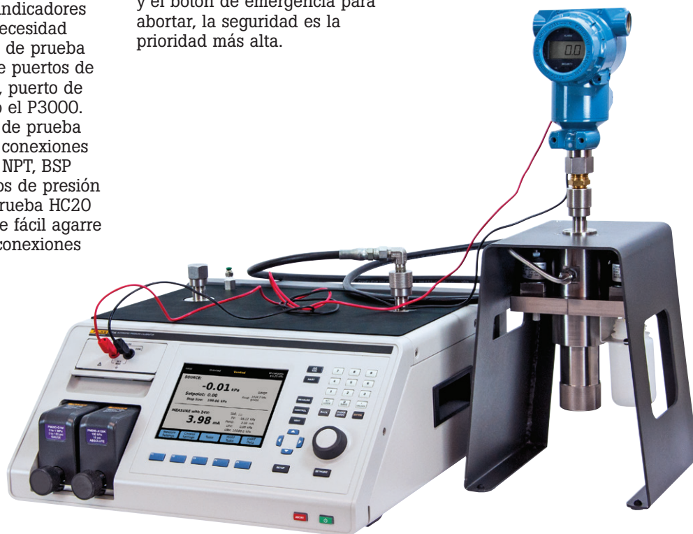
El Sistema de prevención de contaminación ayuda a mantener las válvulas del 2271A limpias y libres de desechos.

El CPS proporciona un nivel de protección sin precedentes al mantener el flujo unidireccional lejos del controlador, un sistema de sumidero de gravedad, y un sistema de filtrado de dos etapas.