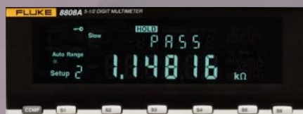
La modalità Limit Compare con gli indicatori del livello "passa/non passa" consente di eliminare gli errori di produzione.