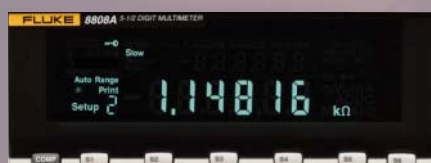
È possibile impostare sei misure più frequenti grazie ai pulsanti del pannello anteriore: per eseguirle, basterà premere il tasto appropriato.