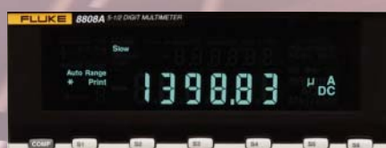
Il modello 8808A può misurare piccole correnti di dispersione con una risoluzione massima di 100 nA, senza sovraccaricare il circuito in fase di test.

Il multimetro Fluke 8808A a 5,5 digit esegue in maniera affidabile le misure più comunemente richieste dalle applicazioni moderne. Sia quando si eseguono test funzionali o quando vengono eseguite misure critiche su particolari punti, la modalità Limit Compare con gli indicatori di "passa/non passa" permette di eliminare gli errori di produzione, soprattutto in quei casi in cui i risultati sono "al limite" dell'accettabilità. Il display del Fluke 8808A dispone di enunciatori integrati che mostrano chiaramente se il test è riuscito o meno. Gli indicatori del livello "passa/non passa" eliminano ogni incertezza.