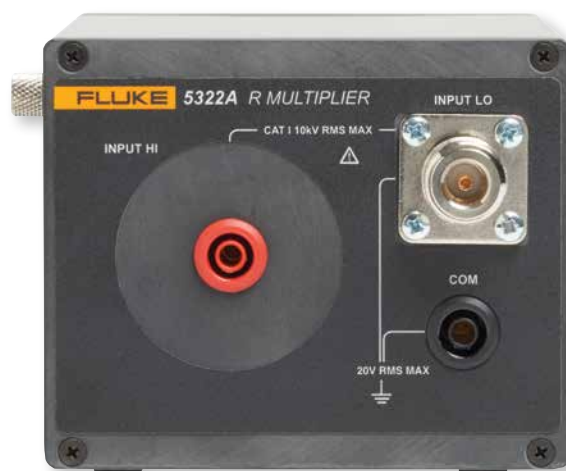
Cada 5322A vem com um multiplicador R externo para fornecer resistências de 10 TOhm para teste de verificadores de isolamento.