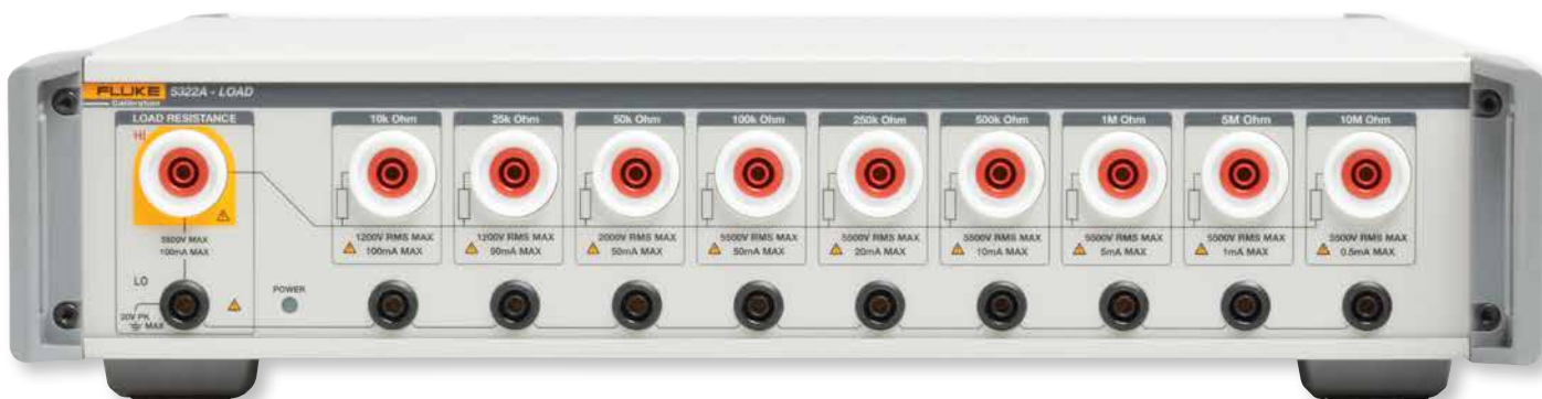
Carga de resistência alta 5322A-LOAD opcional