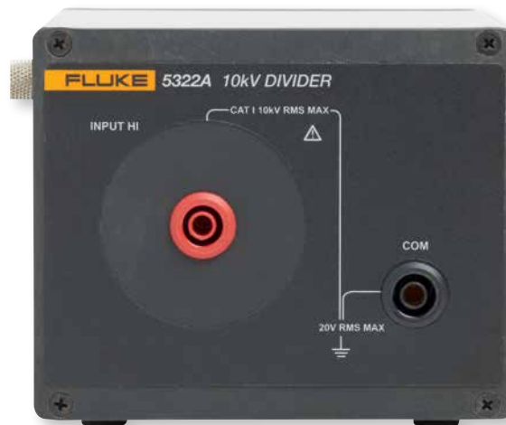
O 5322A inclui um divisor externo de 10 kV para medir verificadores com saídas de 10 kV.

Essa ampla gama de opções de modelo coloca você no controle para escolher o modelo certo e atender à sua carga de trabalho e ao seu orçamento.