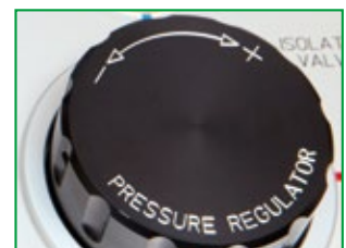
Il regolatore di pressione Minerva MNR 180 è stato specificatamente progettato per le applicazioni di test e calibrazione

Un collegamento girevole ad alta pressione permette di connettere e ruotare il calibratore Additel nella posizione più comoda per l'operatore.