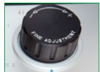
Il regolatore di volume di precisione MNR 90 permette di controllare finemente la pressione entro 100 Pa

Spazio per riporre calibratori supplementari